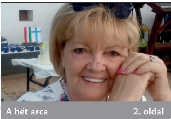
A hét arca