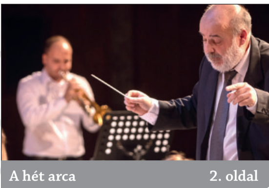
A hét arca