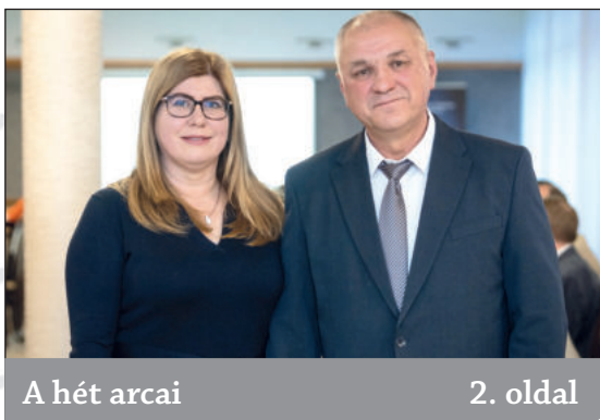
A hét arcai