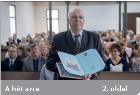
A hét arca