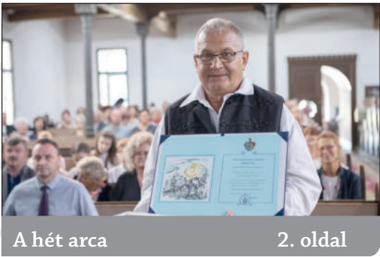
A hét arca