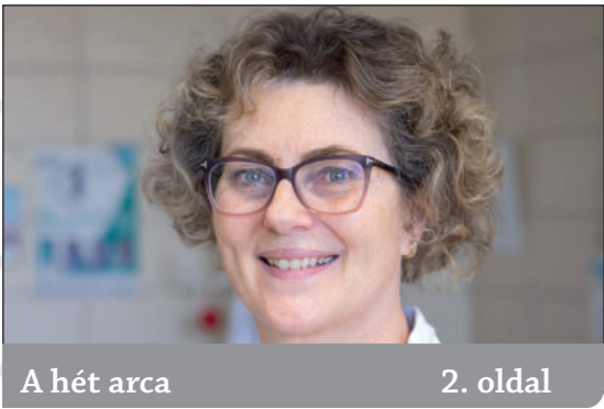
A hét arca