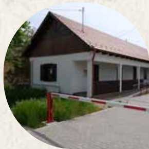
Kézműves Közösségi Ház

A Veres Péter Emlékparkhoz kapcsolódóan került kialakításra egy 16 parkolóállásos rendezvényter és kiszolgáló épület öltözővel. A Semsey Kastély pincéjének látványtárrá történő kialakítását követően egy többfunkciós látogatóbarát tér ad lehetőséget a népi kézműves hagyományok megismerésére.