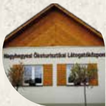
Nagyhegyesi Ökoturisztikai Látogatóközpont

A Nagyhegyeshez tartozó Elep településrészen meglévő épület felújításra került, színvonalas bemutató- és kiállító tér került kialakításra. A projekt keretében épült kilátóból megfigyelhető a szürkemarha tartás és a nevezetes daruvonulás közvetlen megtekintésére is nyílik lehetőség az érdeklődőknek. Emellett a látogatóközponttól 100 méterre létesült egy gyermekbarát játszó- és pihenőhely, valamint egy tanösvény.