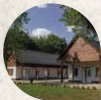
Magyar Szürke Emlékház

Hajdúböszörmény városa már évek óta törekszik a szürkemarha hajtótút hagyományos formában történő bemutatására. Éppen ezért, a jelképes szürkemarha hajtótút „0. km” köve egy szürkemarha szobor formájában korábban el lett helyezve Hajdúböszörményben, ami a hajtótutak kiindulópontját jelképezi.